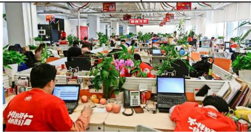
Los cuarteles generales. Estas son las oficinas de AliExpress en Hangzhou, China, una división del gigante Alibaba que se orienta a la compra al detalle.

Ola de pedidos a China hará que lleguen más de cuatro millones de envíos previo a Navidad, y Correos de Chile toma medidas