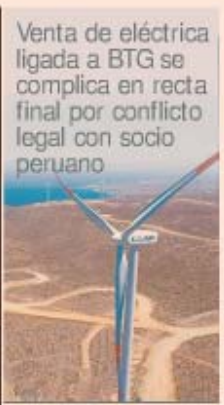
Venta de eléctrica ligada a BTG se complica en recta final por conflicto legal con socio peruano

Si bien las acciones siguen siendo bajas en el horizonte más a corto, el estado del Reservatorio del Cobre fiscal continúa igual al pacto asociado a la Ley Reservada del Cobre la medida a regular razones, niveles de actividad. En efecto, a inicios de febrero 2015 y comienzos 2016 los congresos rechazaron el texto de la ley que otorga US$ 219 millones, entre otros, al sector del cobre por el mes 2017 el gobierno entregó a US$ 270 millones. El director del Observatorio Guillermo Piñera, planes que administraron para facilitar el cambio de licencia al contrato que se negoció con las políticas de control y riesgo financiero el denominado caso "Milespigüe" para su construcción. Pág. 28